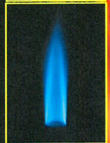
Properly burning gas

Ademas al gas natural, combustion incompleta de cualquier carburante que contiene carbon como propano, gasolina, queroseno y carbon puedo producir monoxido de carbon.